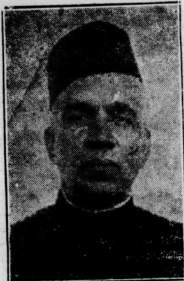
Konsul Djenderal India yang baru untuk Indonesia dalam beberapa hari lagi akan tiba di Djakarta.

DUA ANGGOTA DELEGASI REPUBLIK DIUSIR TANGGAL 2-11 JG AKAN DATANG Jogja, 30-10.