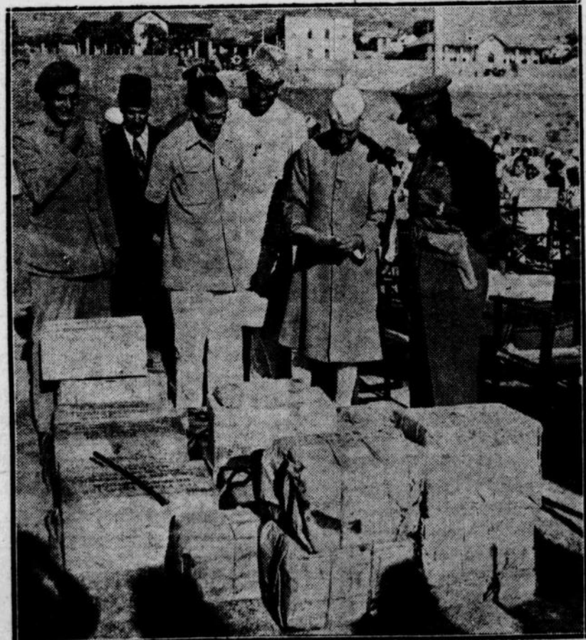
Bagi Nehru tidak ada tempo terluang. Ketika berkunjung ke Kashmir baru2 ini beliau memerlukan juga menjerahkan sendiri obat-obatan. Dibelakang beliau, Sech Mohd. Abdullah, perdana menteri Kashmir, seorang pemimpin yang sangat ditjintai rakyat disana. Dizaman pendjadjahan sampai masa terahir sekali, Abdullah sudah biasa djadi langganan tutupan karena politik.